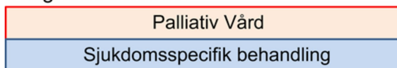
Figur 1: Olika modeller vid palliativ vård. Den klassiska bilden av palliativ vård,