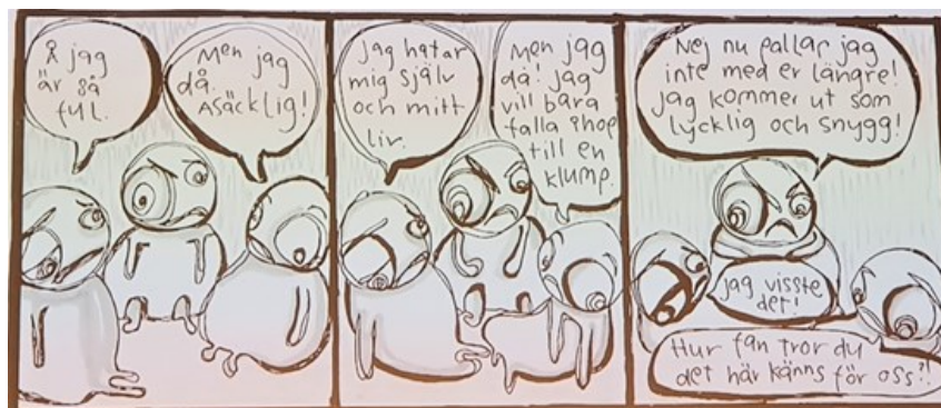
Hur fel det kan bli när positiv förstärkning inte fungerar som det ska.

teammedlemmen känner sig glad och nöjd över sig själv, sin arbetssituation och sin arbetsmiljö.